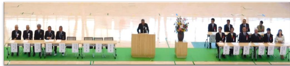
設立5周年記念式典(平成29年11月19日)

今後も、津市の総合的なスポーツ推進を担う団体として、更なる活動の充実を図るほか、「三重とこわか国体」の成功に向け取り組んで参ります。